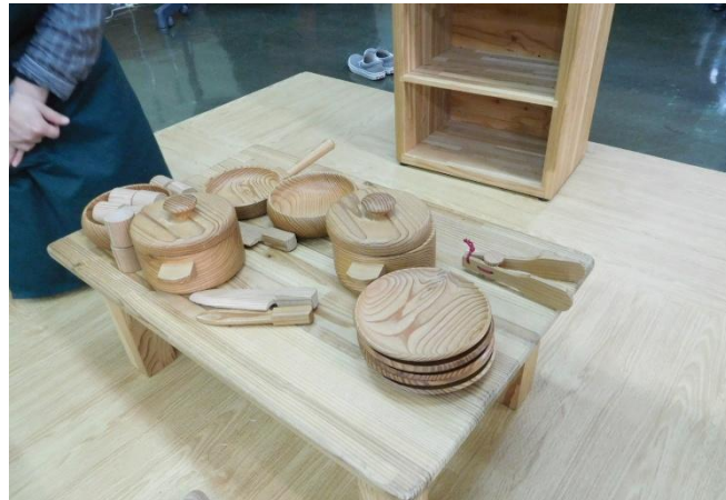
テーブルと食器と食器棚