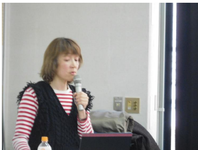
橋本さんのレクチャー