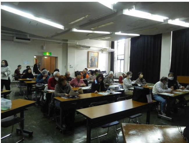
受講生 26 人