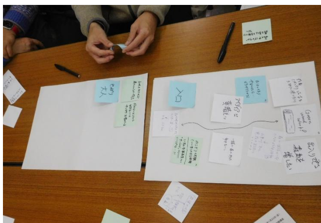
付せんを題材にした話し合いが深まる