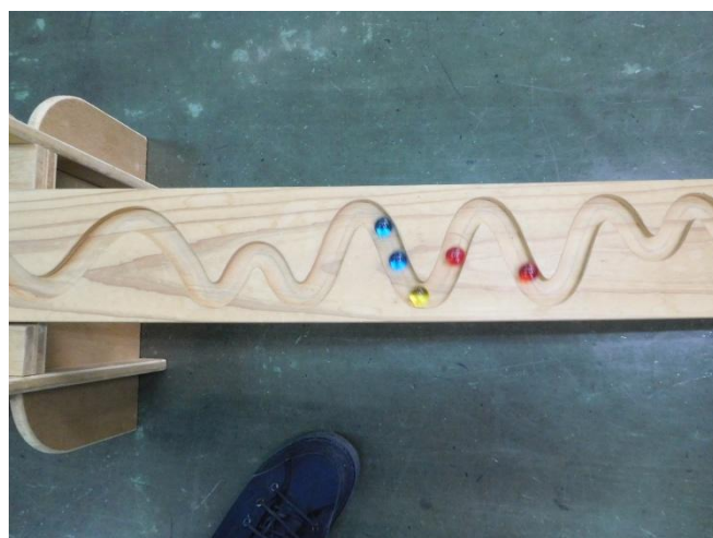
ロングスロープを走るビー玉