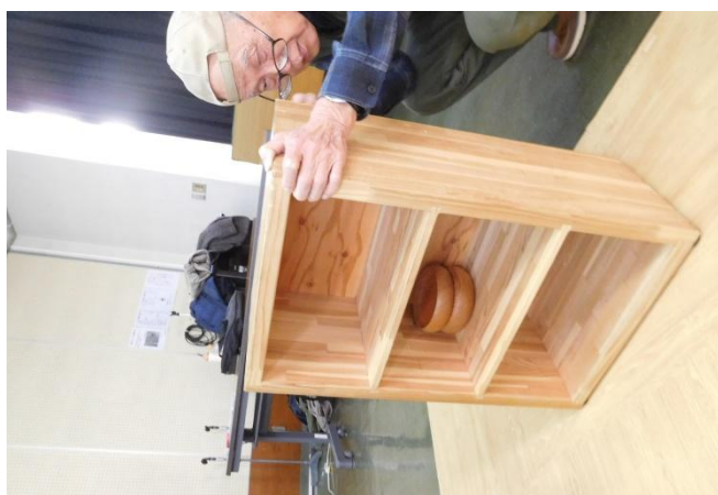
食器棚とテーブルのセット