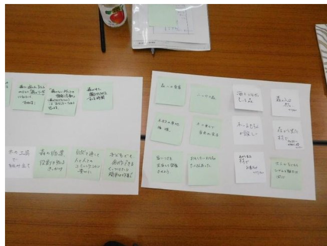
付せんが集まった