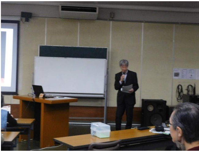
三末課長から講座の説明