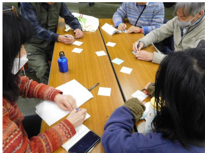
付せんに書き留める