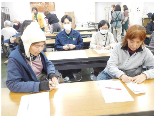
グループワークの様様