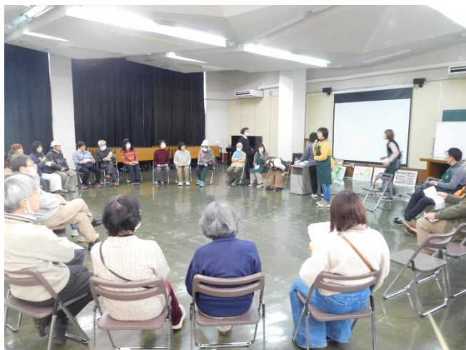
ちばの木おもちゃの紹介