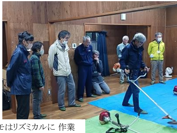
刈払機操作の実演デモはリズムカルに 作業