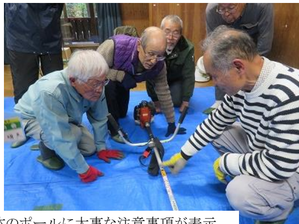
グリス注入は大事です、本体のポールに大事な注意事項が表示