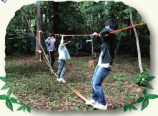
スラックラインって意外とおもしろいよね！笑