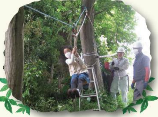
ターザンロープをシューっと！