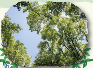
森からみた空、木の葉がゆらゆら～