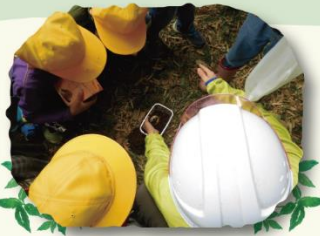
なにかをハッケン！虫かな...？