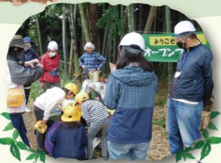
オープンフォレストはじまるよ！