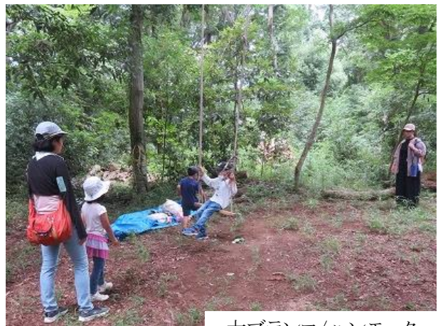
大ブランコ/ハンモック