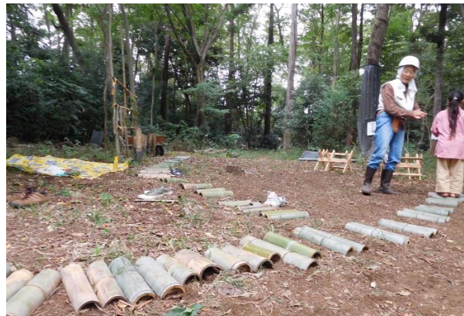
竹のレール拡大中 素足で歩くのが気持ちよさそう