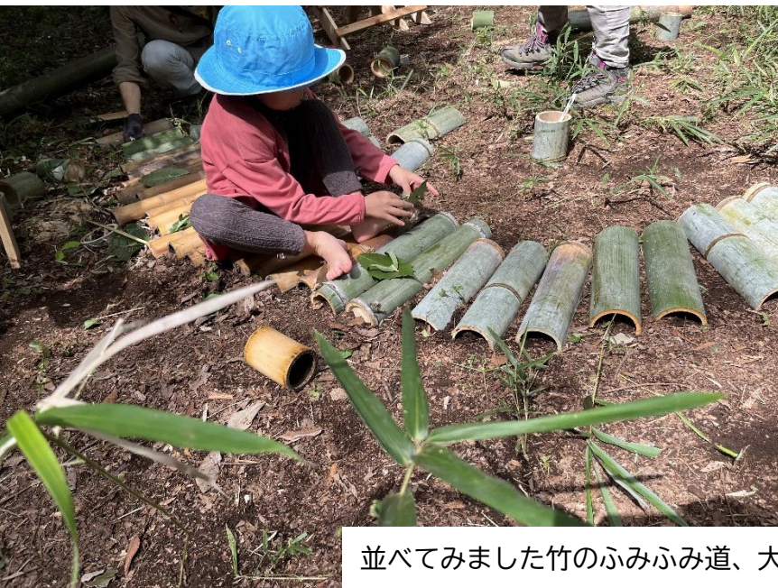
並べてみました竹のふみふみ道、大人も歩いたら気持ちよい