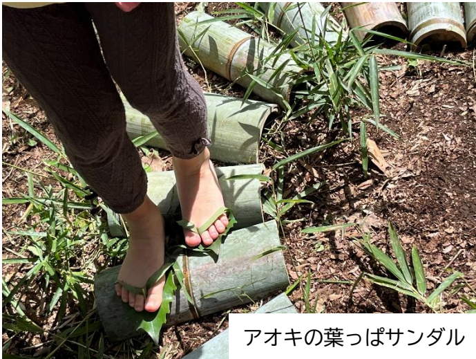
アオキの葉っぱサンダル