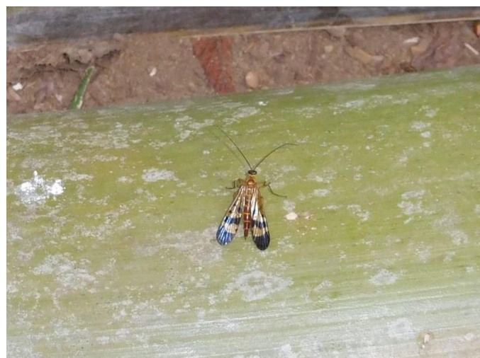
ヤマトシリアゲムシかな？