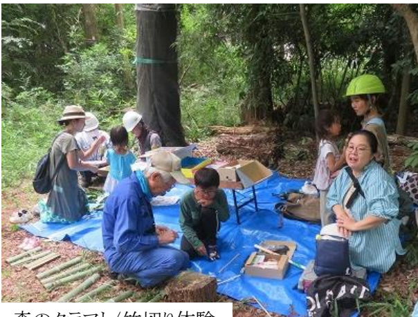
森のクラフト/竹切り体験