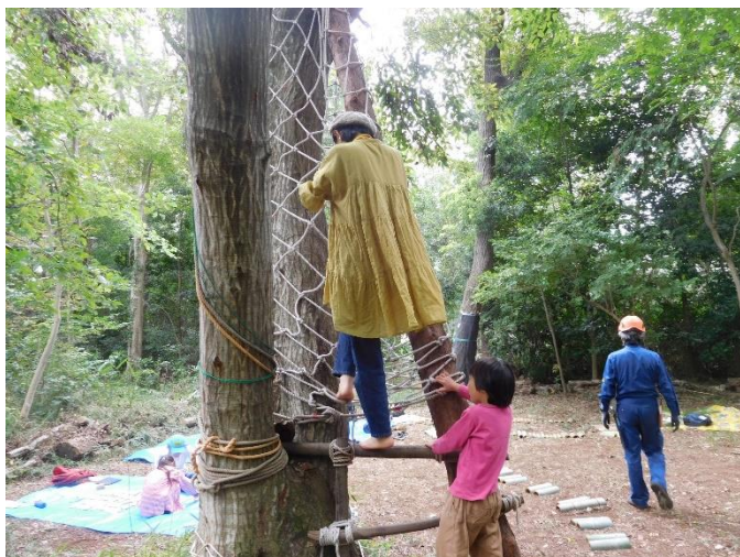
木登り体験中、大人は素足ではきついとか