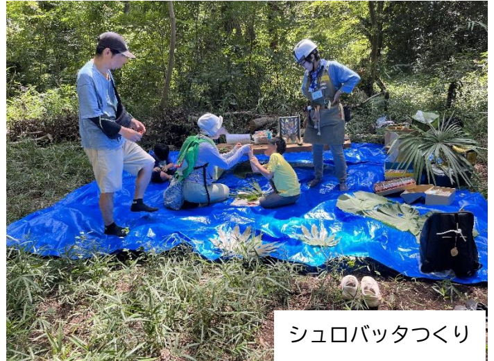
シュロバツタづくり