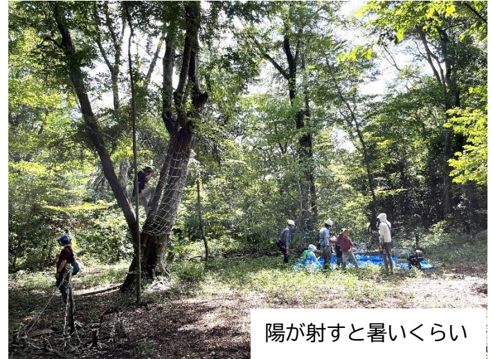
陽が射すと暑いくらい