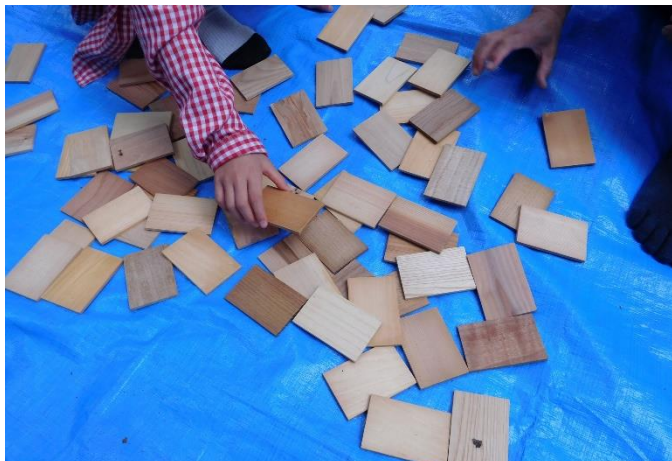
板目合わせの神経衰弱 46枚あるとかなりハード 竹ノコギリでカット中

天気=晴れから曇り。気温は午前中日の射した時間帯は暑いほどだったg、午後から冷たい風が吹いてきた。ネイチャーゲーム、シュロバッタにキンギョに夢中になった大人たち。7月から始まった、竹を使った線路づくりは本格的になってきた。森活動に邪魔にならないようにそっと敷いてある。