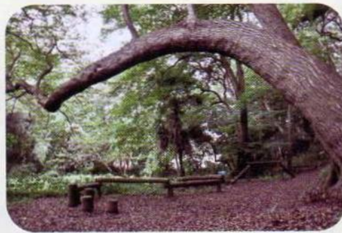
屋敷林には不思議な形の樹木もある