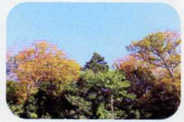
モミとケヤキの紅葉