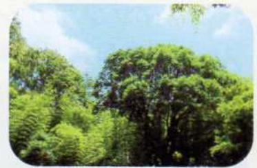
竹林とご神木のシラカシ

当会では、森の整備に加え、森の材料を用い、細工物、草木染、炭焼にも取り組んでいる。