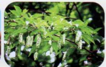
クマシデの若い果穂