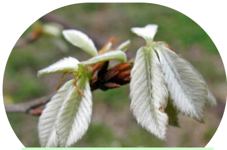
コナラの若葉 ウサギのミミ