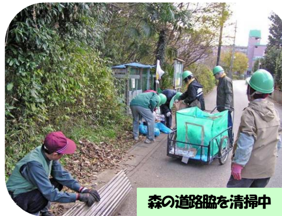
森の道路脇を清掃中