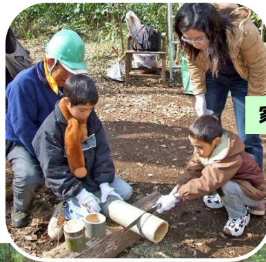
家族揃ってお楽しみ会