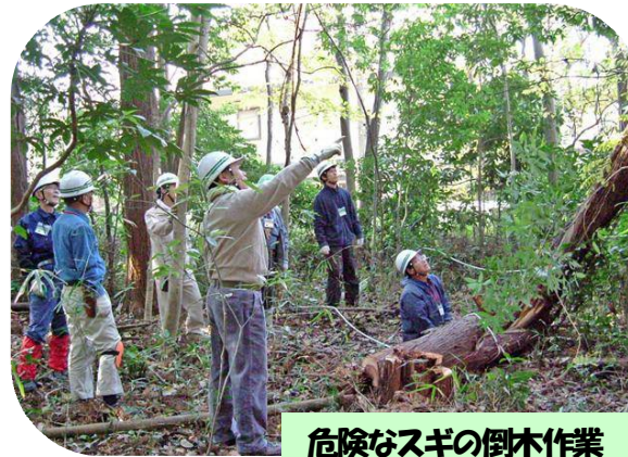
危険なスギの倒木作業