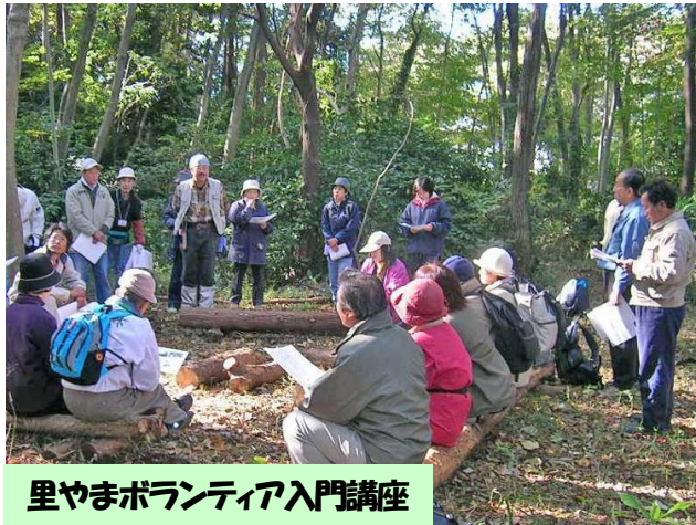
里やまボランティア入門講座