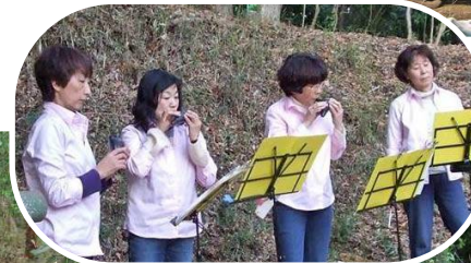
森を楽しむ音楽会