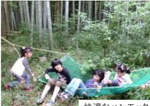
快適なハンモック