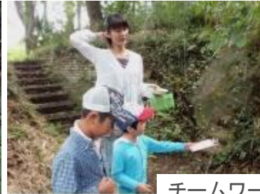
チームワークで探して～