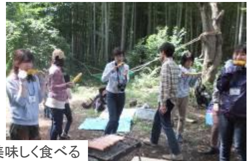
たき火で焼いて 美味しく食べる