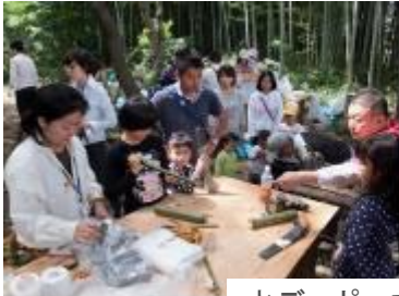
水デッポーを作って遊ぶ