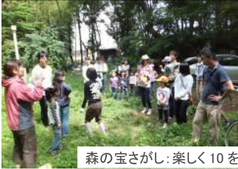
森の宝さがし: 楽しく10を見つける