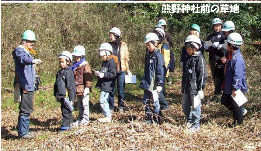
熊野神社前の草地