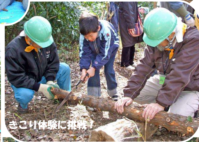
きこり体験に挑戦!