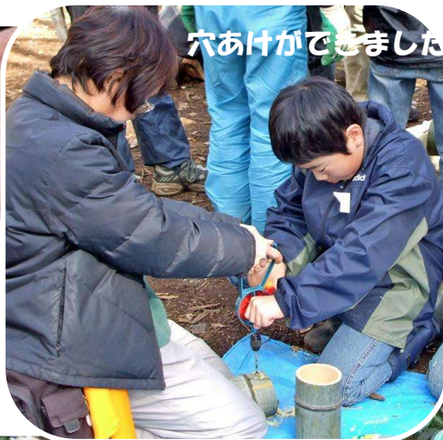
穴あけができました