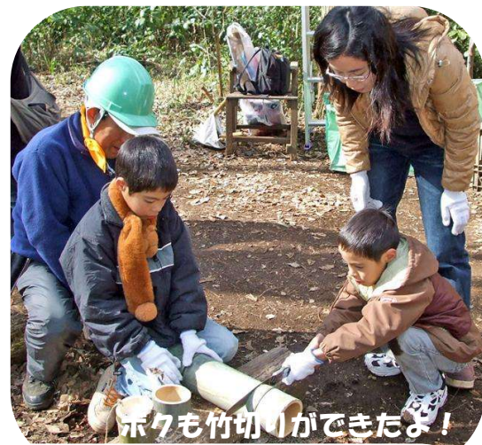
ホクも竹切りができたよ!