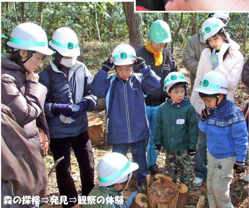
森の探検⇒発見⇒観察の体験