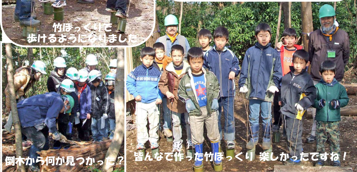
倒木から何が見つかった? みんなで作った竹ほっくり 楽しかったですね!