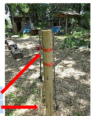
チェーンソーの刃