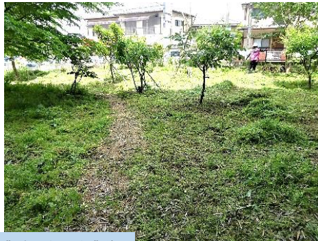
植栽域の草刈り 左：作業前 右：作業後