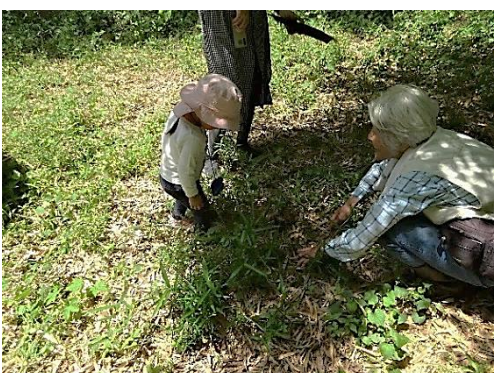
OF 来森でタケノコ掘り体験