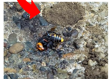
眠気まなこ?キイロスズメバチ