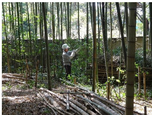
マダケの間伐・整備