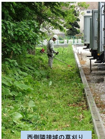
西側隣接域の草刈り