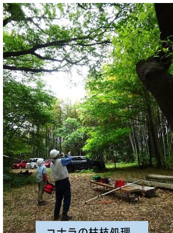
コナラの枯枝処理