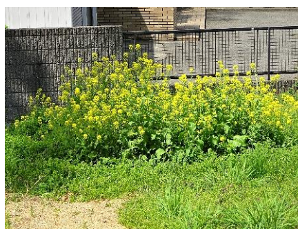
STGのイベントで種まきしたタンポポ 満開