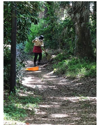
森の進入路の整備