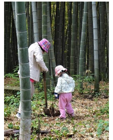
4/23 子どもっとまつどでの1コマ