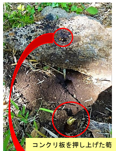
コンクリ板を押し上げた筍