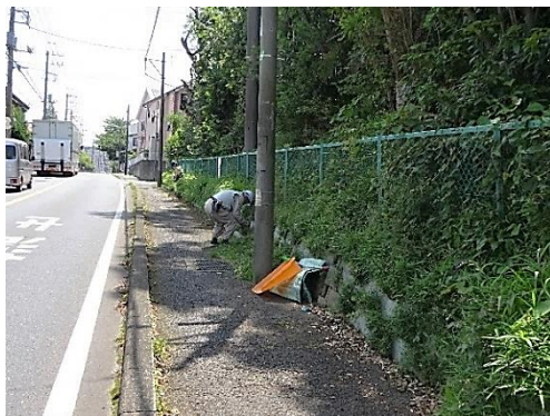
外周の草刈り・清掃