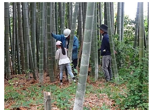
モウソウの伐倒体験