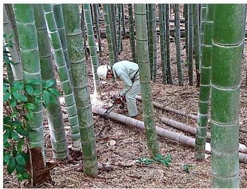
枯れたモウソウ竹の伐倒処理