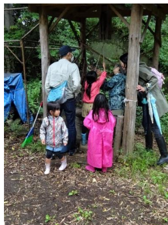
井戸には興味ありそう