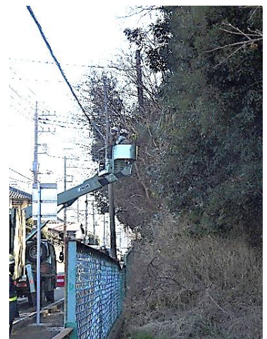
業者・高所作業車による伐枝作業