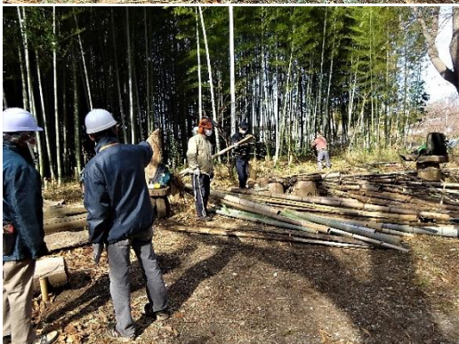
堆積していた竹材のチップ化作業