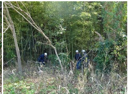
太い枝の折れたクヌギ 処理中(右)