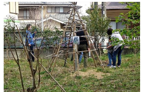
3/12 STG 林内を案内・散策