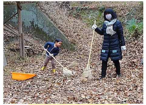
1/22 STG 落ち葉集めに興じる