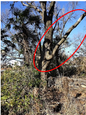
朽ちかけているケヤキ