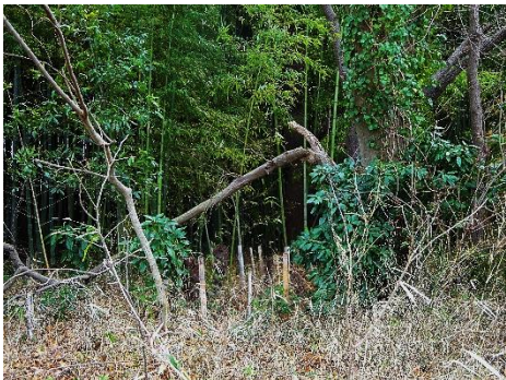
西側竹林外のクヌギ 次回処理の予定