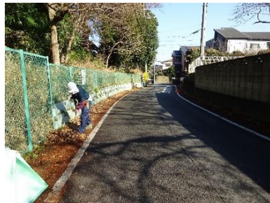
フェンス外周の落ち葉の清掃