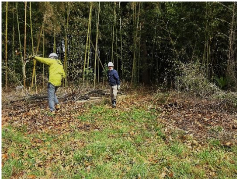
森の南西域 マダケ・枯枝・枯れた雑草などで結構荒れた状況でした