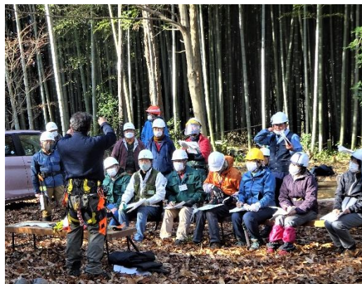
1/20 安全な伐竹と竹の搬出研修