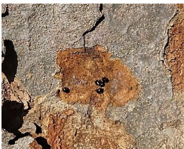
樹皮の中にフタモンクロテントウ