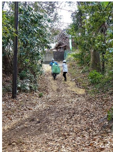
チップ材を出入り進入路に散布