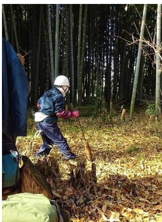
竹の切り株の処理