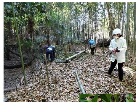
右：白い実をつけた万両 上：保護柵を施す