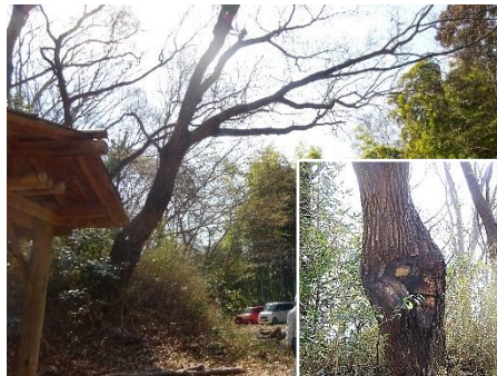
広場中央にあるコナラ 過去に枝が折れた後に サルノコシカケがつき 枯枝も多くみられる