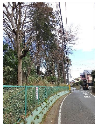
業者による伐枝作業はほぼ終了